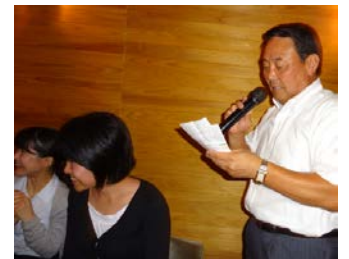
支部長の替え歌にクスクス