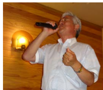
最後まで盛り上げ役の顧問