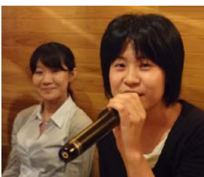
青森支部の象徴は女傑 皆が期待しています