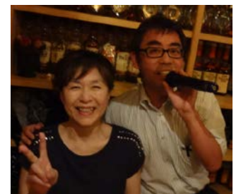
お世話になったママと カメラ担当の白取会員